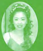
やまとこおりやま観光PR大使 演歌歌手 山口 智世