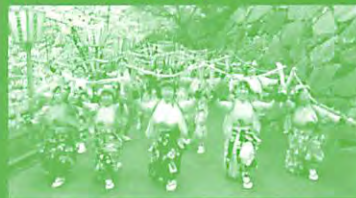
日本南京玉すだれ協会 美都香会