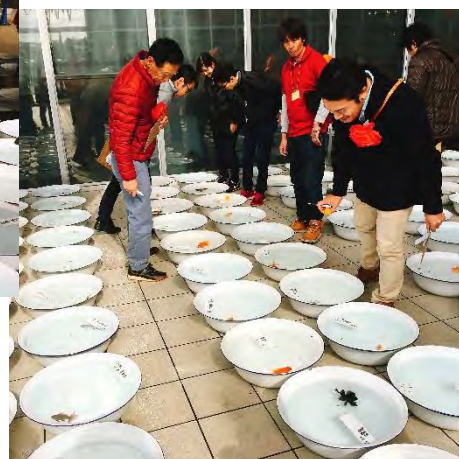
↑ 審査員による審査中