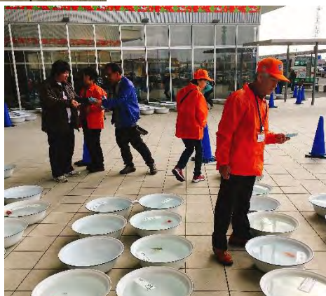
金魚マイスターも審査 させていただきました。