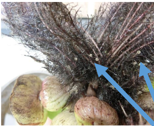
水草(ホテイアオイ)に生んだメダカの卵