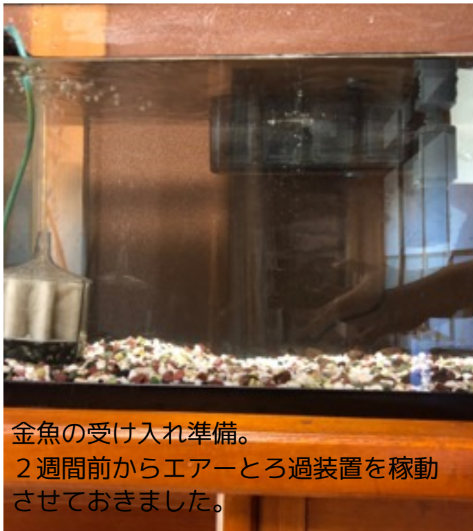
金魚の受け入れ準備。 2週間前からエアートろ過装置を稼動 させておきました。