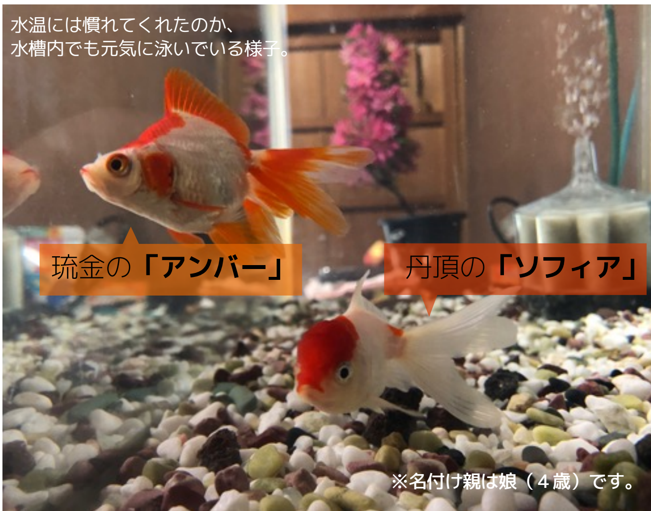
水温には慣れてくれたのか、 水槽内でも元気に泳いでいる様子。