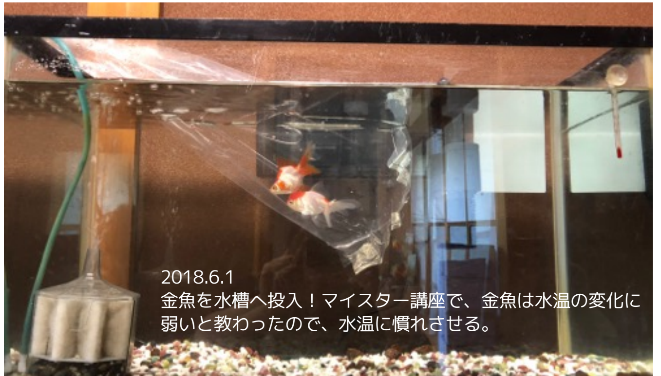
2018.6.1 金魚を水槽へ投入！マイスター講座で、金魚は水温の変化に 弱いと教わったので、水温に慣れさせる。